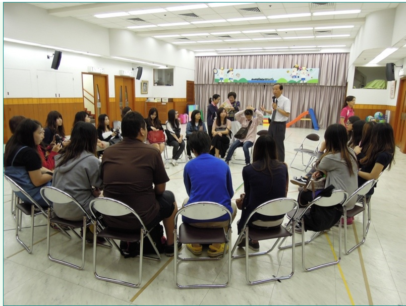
圖說：亞洲大學幼教系與創價幼稚園進行交流座談。