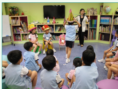
圖說：亞大海外幼教研習團參觀香港創價幼稚園，進班觀摩。