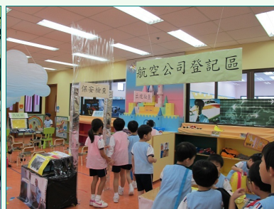
圖說：香港創價幼稚園遊戲教室的布置，5月的主题是飛機，幼兒可從中了解機場工作。